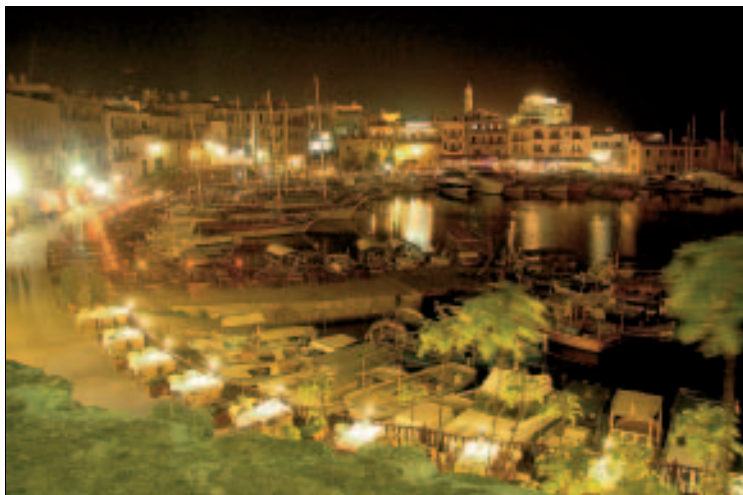
Girne, Zyperns schönster Hafen