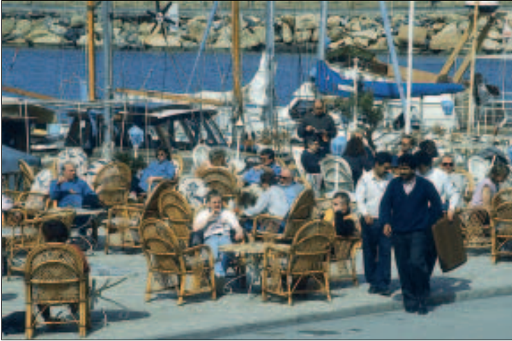
Am Hafen von Girne

The Adress ist am Westende von Karaoğlu von der Hauptstraße meerrwärts aus beschildert. Karaoğlu, ☎ 8223237; Ⓛ tägl. mittags und abends (dann Reservierung empfohlen) geöffnet.