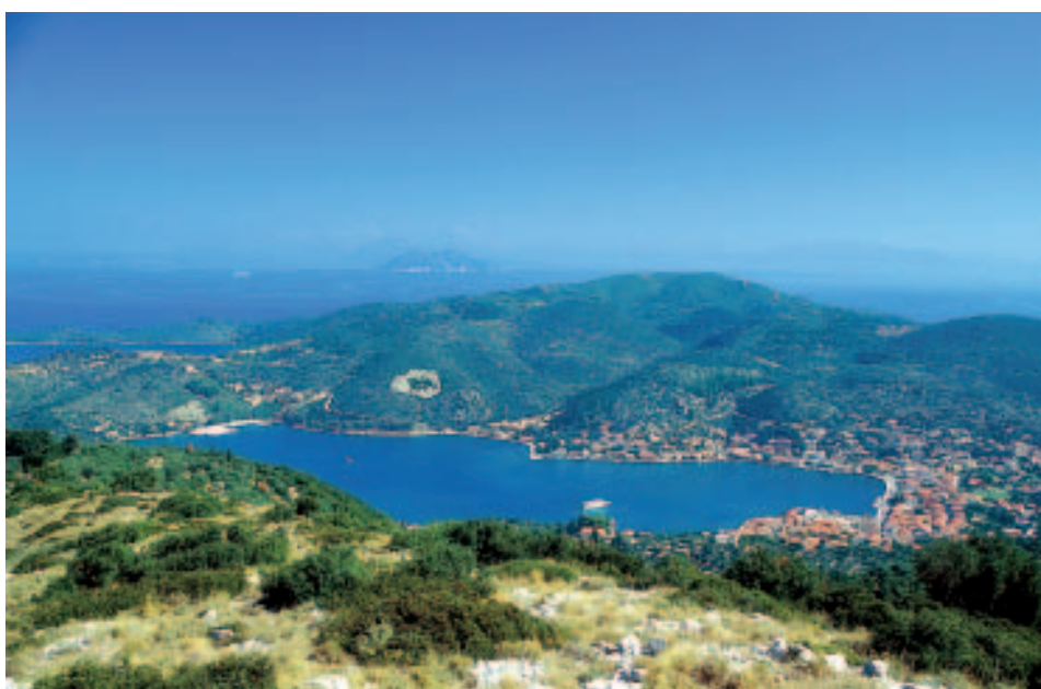
Traumhaft gelegen: die Inselhauptstadt Vathi