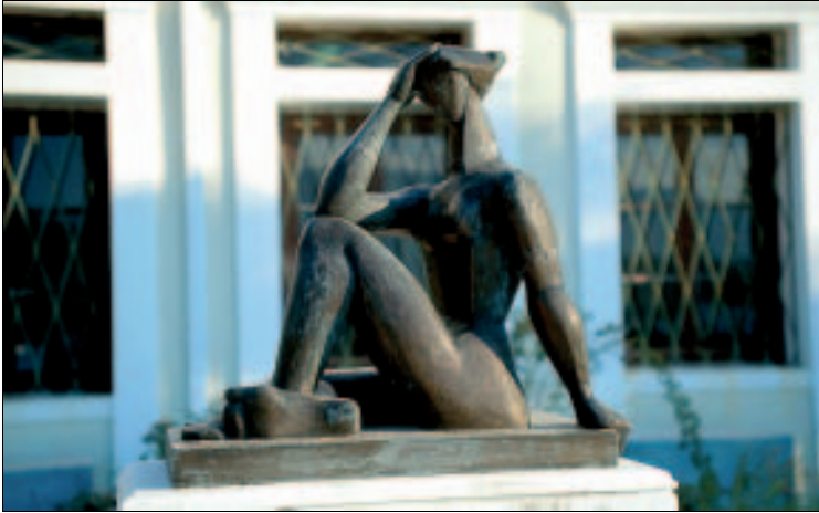
Wenn er doch nur mal angerufen hätte – Penelope, sinnigerweise vor dem Gebäude der griechischen Telefongesellschaft

nach Pátras: pro Person 14,50 €, Auto 55 €, Motorrad 11,10–16,70 €, Wohnwagen/-mobil 13,90 € pro Meter.