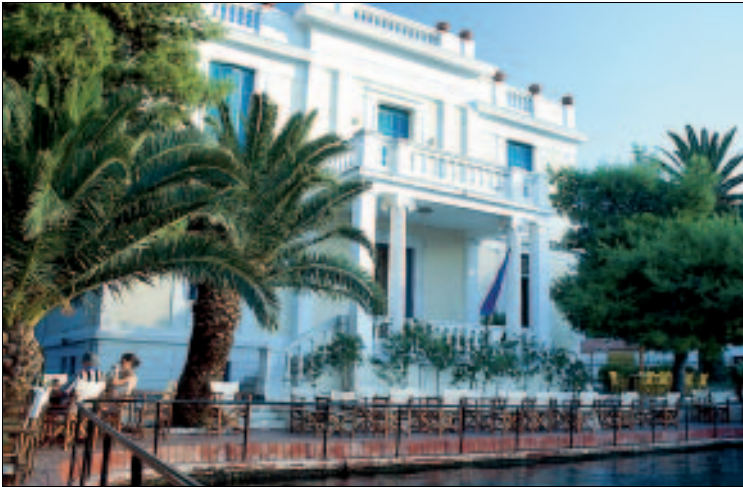
Stilvoll – Bar Drakoulis

Seit Anfang der 1990er Jahre arbeitet ein Team von griechischen und amerikanischen Wissenschaftlern daran, den Ursprung und die Bedeutung des Apollonkults genauer zu erforschen. Hinzu kommen eine Vielzahl von Fundstücken aus mykenischer Zeit (1600–800 v. Chr.). Neben den Funden vom Berg Aetós sind auch einige Stücke aus der eingestürzten Louízos-Höhle in der Polís-Bucht zu sehen, in Raum 4 außerdem Münzen und Weihgaben aus der Nymphengrotte. Weitere Fundstücke lagern in den Nebenräumen des zu klein gewordenen Museums. Man plant einen Neubau, wann dieser entstehen soll, ist allerdings ungewiss. Auch die neuesten Funde aus mehreren groß angelegten Forschungsprojekten zum Thema Odysseus sind hier leider noch nicht zu sehen.