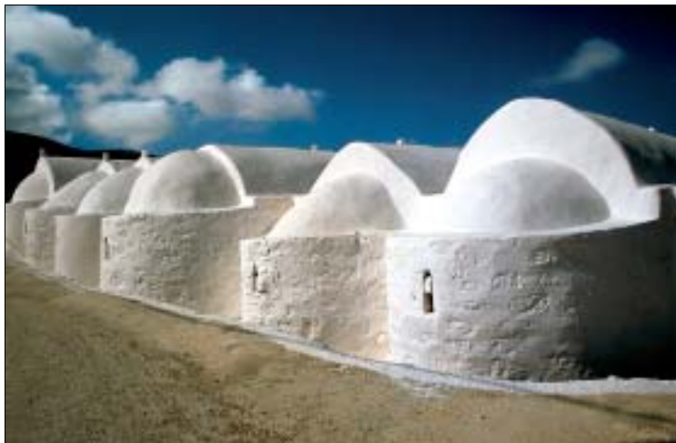
Einzigartig in der Ägäis – die Neráiden von Panagía

wieder türkische und mit diesen verbündete ägyptische Schiffe und Stützpunkte angriffen. Daher beschlossen die Osmanen, Káossos zu zerstören. Am 27.5.1824 belagerten sie die Insel mit 45 Kriegsschiffen und 4.000 Soldaten. 12 Tage hielten die Kassioten stand, dann war ihr Widerstand gebrochen. Verrat soll es gewesen sein, der zu einem Massaker ohnegleichen führte. Ein früher auf Káossos lebender Albanergriecher, den man angeblich wegen seiner Schlechtigkeit von dort vertrieben hatte, rächte sich, indem er den Soldaten des Sultans einen Platz zeigte, an dem sie nachts unbemerkt auf die Insel kommen konnten. Hier töteten sie weit mehr als 1.000 Kassioten, eine noch größere Anzahl wurde versklavt, die Insel geplündert und vernichtet. Wer es noch schaffte, floh nach Káarpathos oder anderswohin.