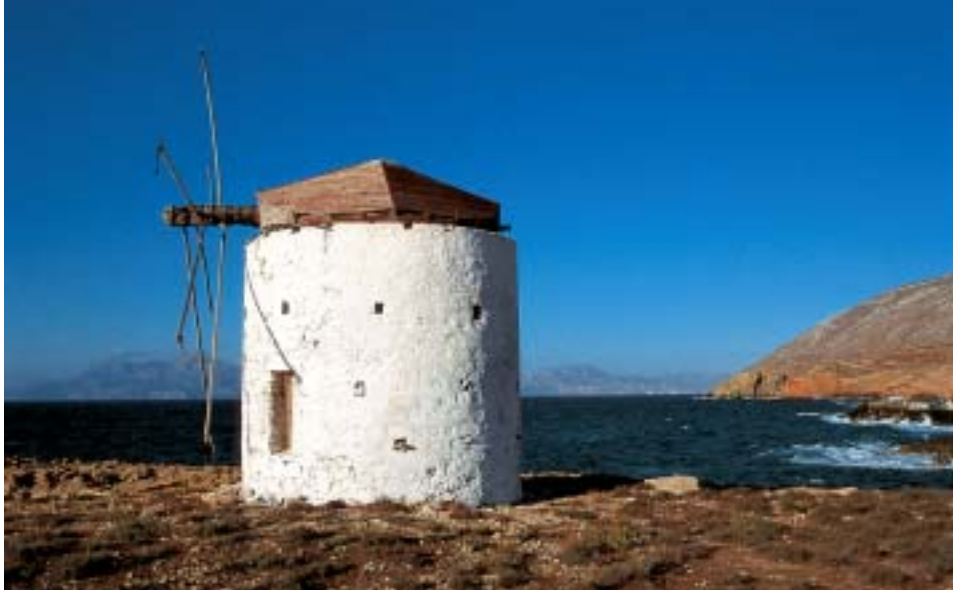
Windmühle bei Phry, im Hintergrund Kárpáthos