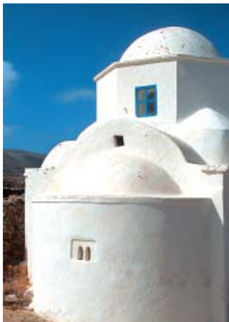
In Panagia entdeckt man auf Schritt und Tritt Kapellen

Im Klosterhof finden Sie nahe der Kirche eine Zisterne mit sehr gutem Trinkwasser. Der Platz ist zum Relaxen wie geschaffen. Früher wurde das Kloster von Nonnen bewohnt, heute stehen die Gebäude leer.